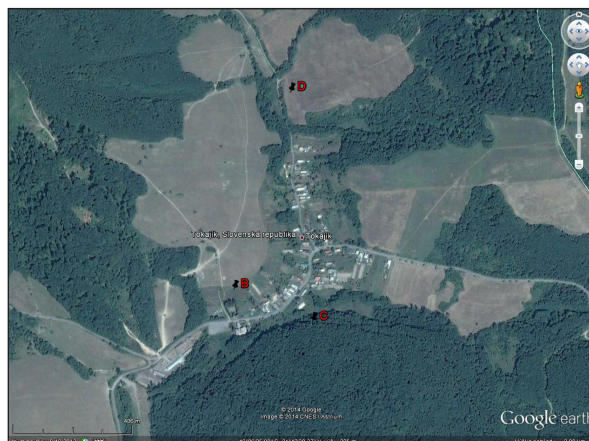
Obrázok 1. Študijné plochy v okolí obce Tokajik.

Na porovnanie druhovej zhody (podobnosti) na porovnávaných študijných plochách (B a D) boli použité Jaccardov index (Ja) a Sørensenov index (Sö). Na vyjadrenie druhovej rozmanitosti boli vypočítané Shannon-Weaverov index diverzity a vyrovnanosti (H a J); Simpsonsonov index diverzity a vyrovnanosti (D a E). Na vypočítanie príslušných indexov bol použitý štatistický program PAST verzia 2.71b (HAMMER et al. 2001). Rovnako na porovnanie početnosti spoločných druhov v oboch študijných plochách bol použitý chi-kvadrát test ( \chi^2 ) za použitia štatistického programu GraphPad Prism version 5.01 (GraphPad Software, Inc., San Diego, California, USA).